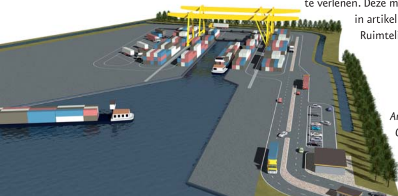
Artis Impression van de Overslag Terminal Alphen

In een later stadium liggen de plannen opnieuw zes weken ter inzage, nadat burgemeester en wethouders (b&w) hebben besloten om voor die plannen artikel 19 van de WRO toe te passen. In die tweede periode van zes weken kan iedereen bij b&w zienswijzen c.q. bezwaren indienen tegen het voornemen om voor die plannen van het geldende bestemmingsplan vrijstelling te verlenen. Nadat b&w voor de plannen van het geldende